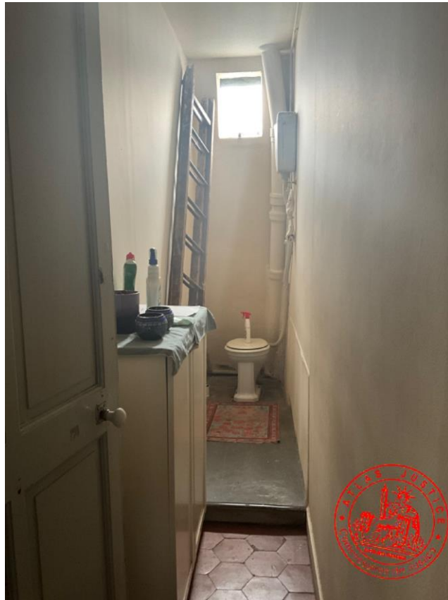
Wc sur palier