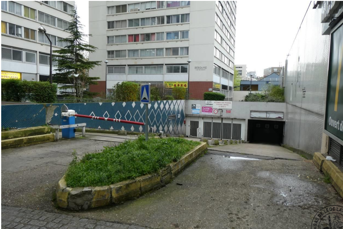
1 Entrée par l'avenue de Choisy P13