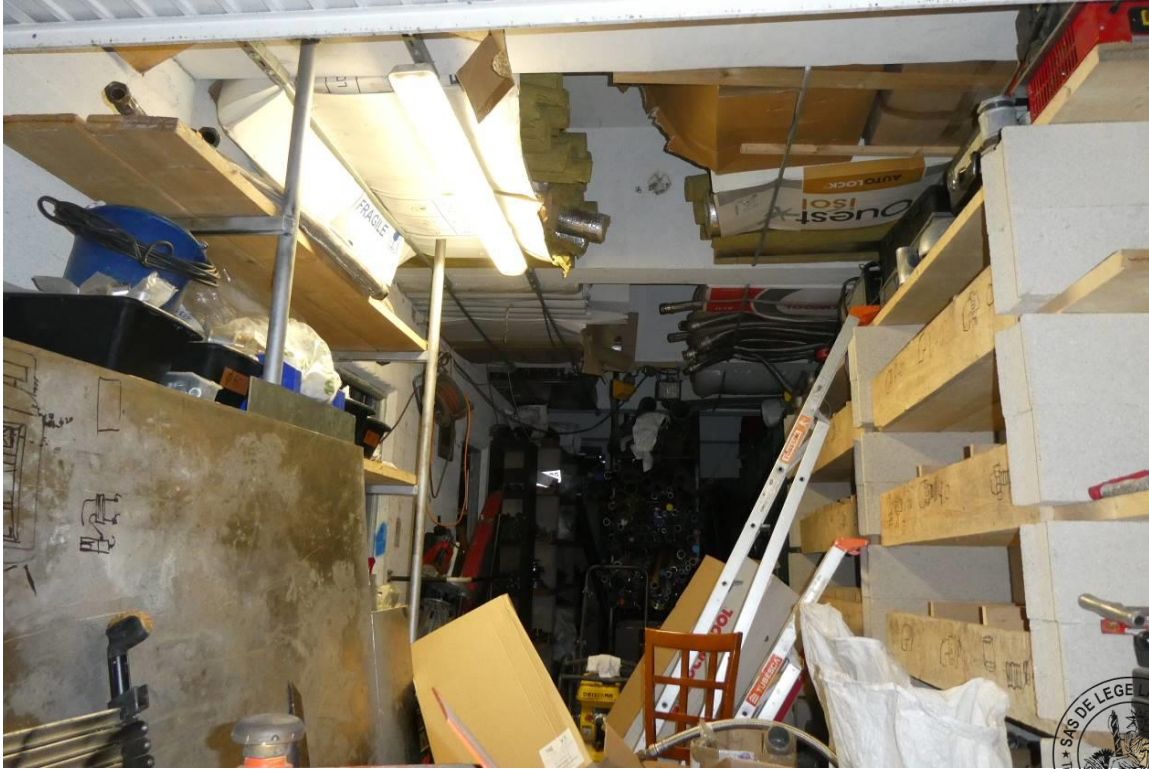
7 Box 2, d'un seul tenant avec le box 17