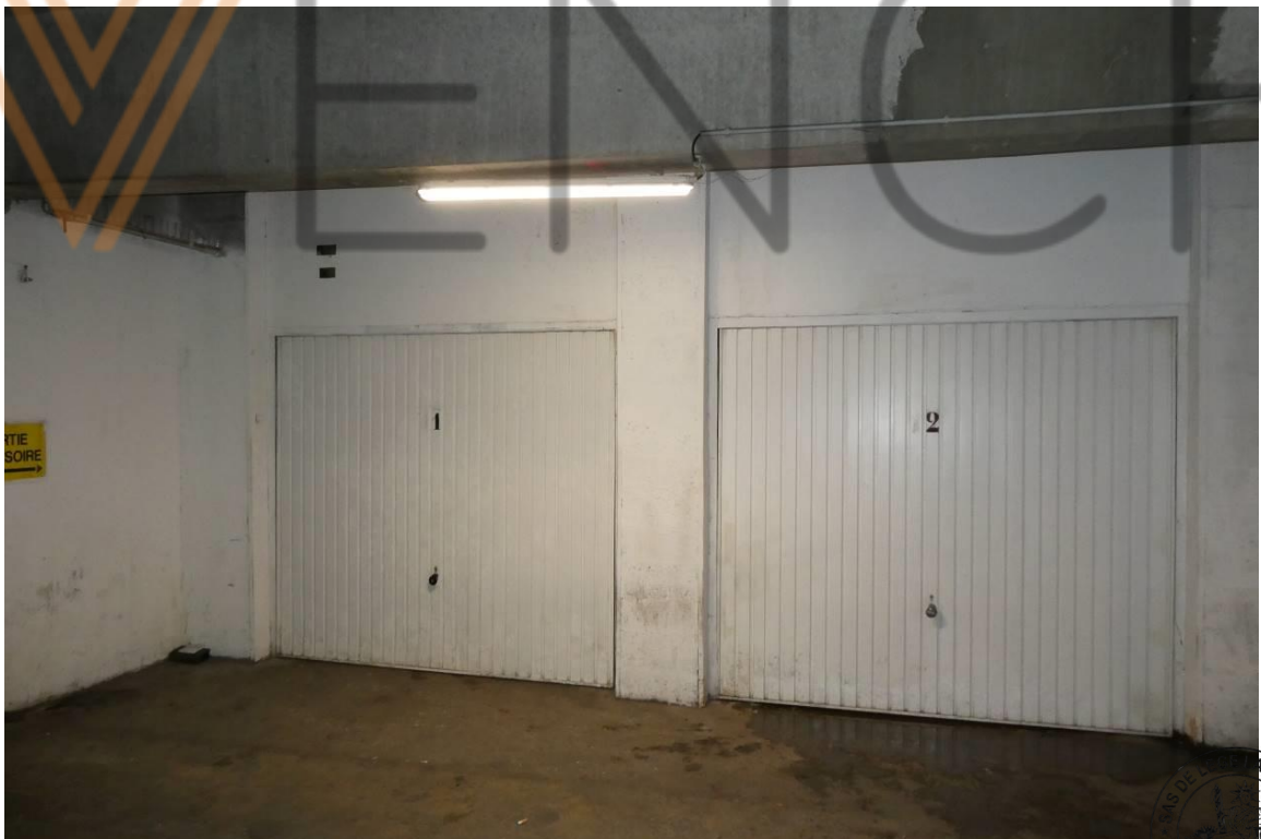
2 Boxes 1 et 2