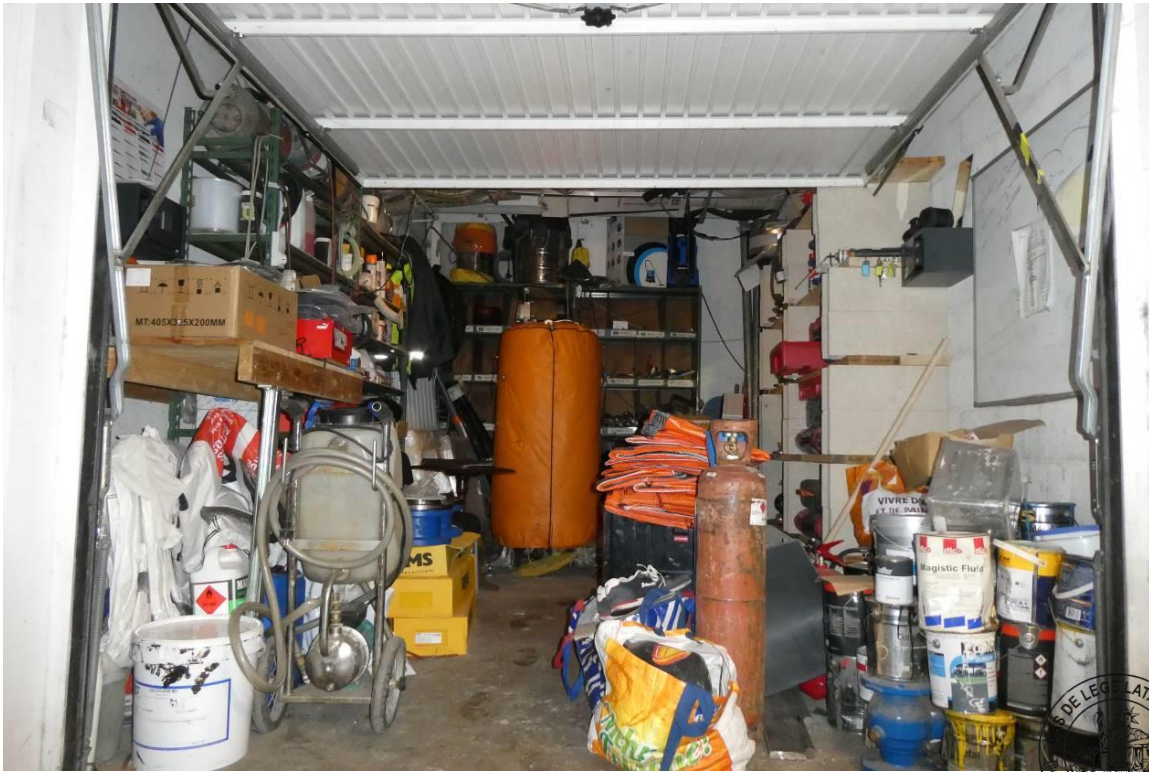
3 Box 1