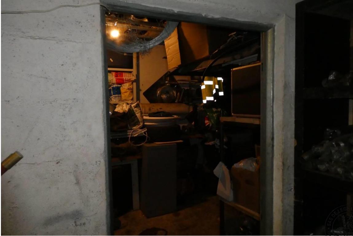
9 Accès latéral par le box 17 au box 18